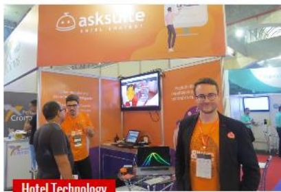
HFN: Asksuite triplica receita em 2019